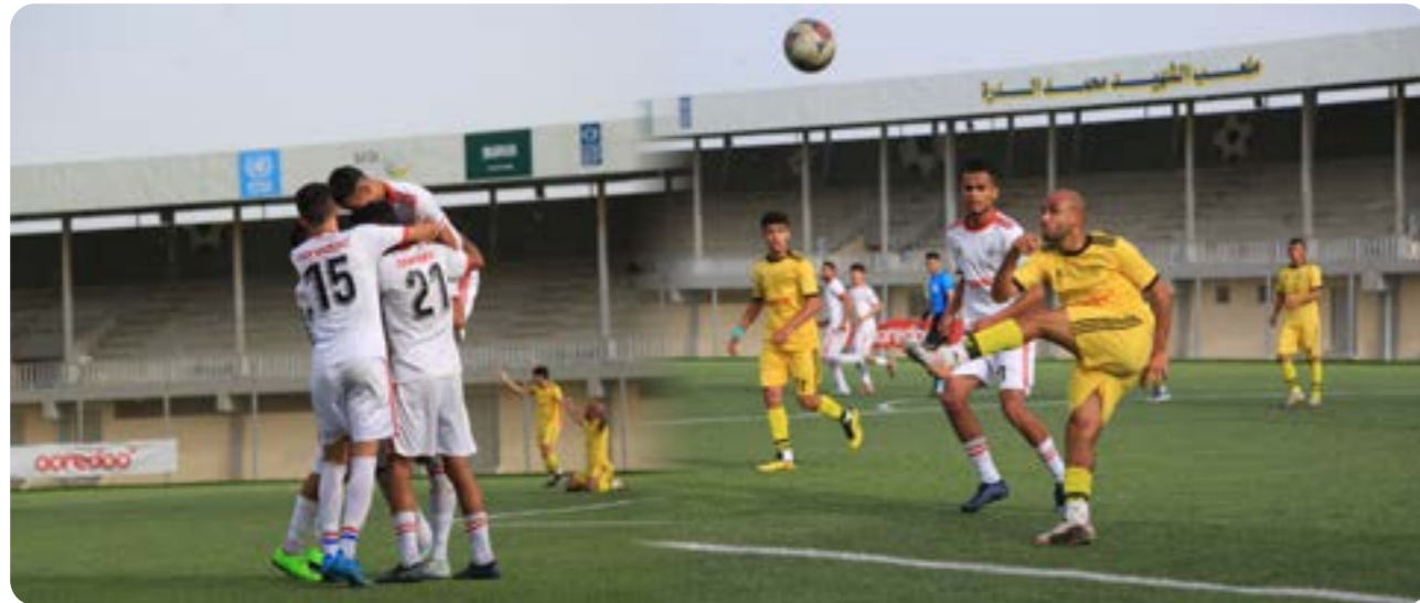
دوري الدرجة الممتازة