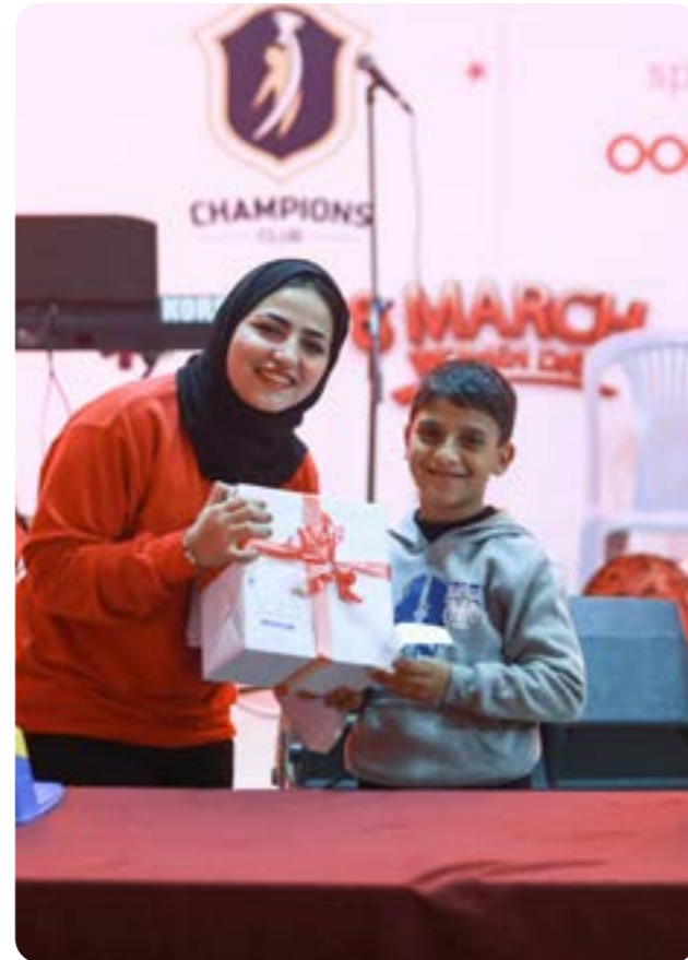
رعاية مهرجان الصيف مع نادي تشامبيون