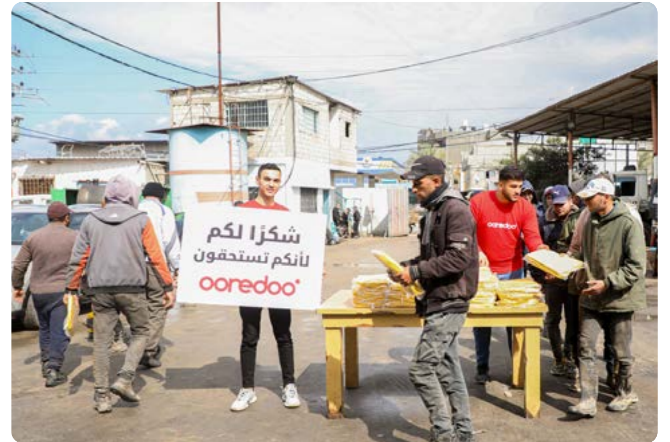
التبرع لصالح موظفي بلدية جباليا بزي شتوي