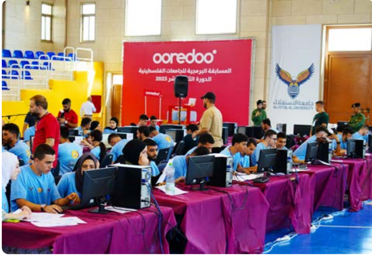
رعاية مسابقة الجامعات للبرمجة