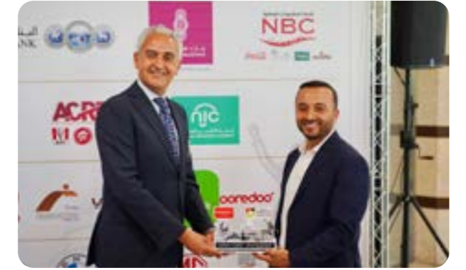
توقيع اتفاقية تعاون مع بلدية رام الله