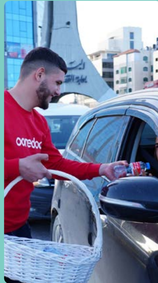
توزيع التمر والماء على الصائمين

تعزز Ooredoo فلسطين مكانتها كشريك فاعل في مجال العمل الخيري من خلال تقديم المساعدات في أوقات الحاجة، حيث تعمل الشركة على توجيه الجهود نحو المساعدة وتوفير الدعم للفئات المحتاجة بتنوعها