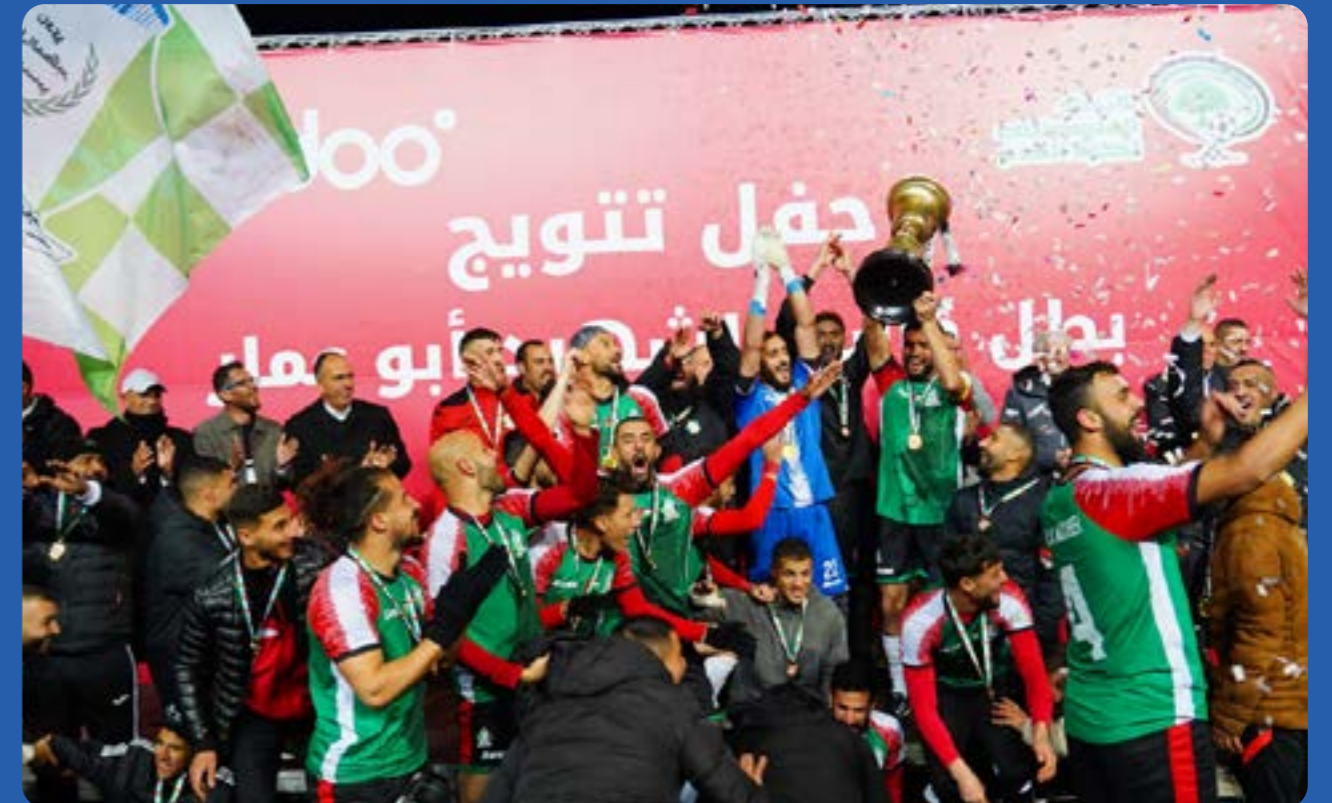
نهائي كأس الشهيد أبو عمار

في إطار التزامنا بدعم الشباب وتنمية المواهب، قامت Ooredoo فلسطين بختام رعايتها السنوية لكرة القدم الفلسطينية للعام الثامن، والتي شملت كلاً من دوري المحترفين في الضفة، والدوري الممتاز في قطاع غزة، ونهائي كأس أبو عمار، بالإضافة لرعاية المنتخب النسوي لكرة القدم. استمرت الشركة في توفير الدعم والموارد الضرورية لتعزيز تطوير كرة القدم في فلسطين، ما أسهم في بناء لاعبين مميزين ينافسون محلياً ودولياً، ويحملون علم فلسطين في مختلف المحافل الرياضية.