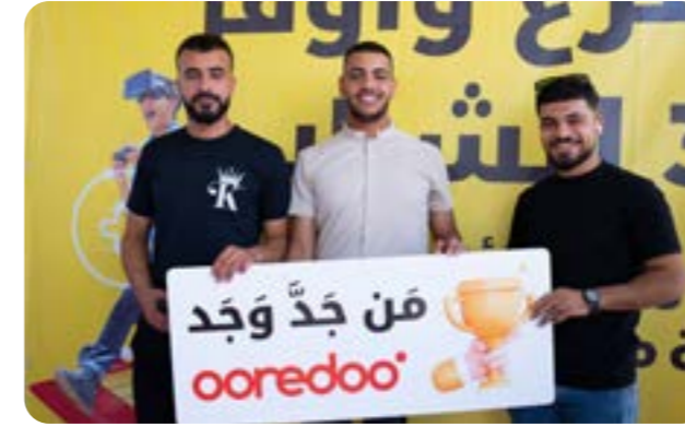
إقامة أنشطة وفعاليات لطلاب الجامعات والكليات