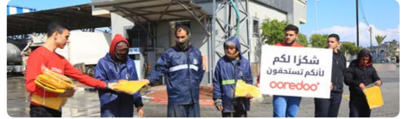
التبرع لصالح موظفي بلدية رفح بزي شتوي