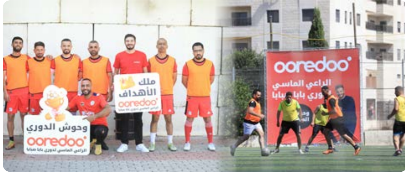
رعاية دوري بابا صابا