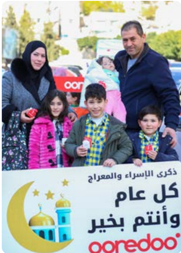
فعالية ذكرى الإسراء والمعراج